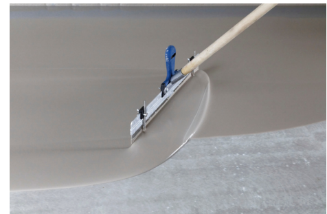
PCI FT Plan überzeugt mit einem sehr guten Verlauf und einer glatten Oberfläche