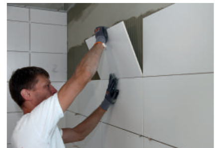
Funktionssichere Fliesenverlegung im Dünnbettverfahren mit PCI FT Klebemörtel